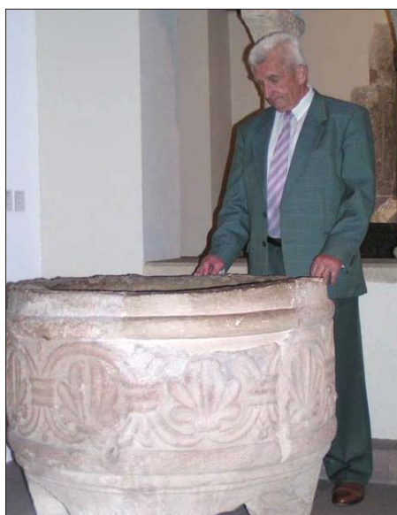
Cuve baptismale en grès rose, 1140, provenant de l'église Saint-Martin à Zellwiller (67). Musée de l'Œuvre Notre-Dame, Strasbourg.

Un grand nombre de cuves baptismales comportant des éléments du XIIe siècle ont été progressivement abandonnées au profit de la mise en place d'un équipement spécifique dans toutes les églises paroissiales. Les cuves baptismales du XIIe siècle en pierre sont en majorité cylindriques, elles mesurent un peu plus d'1m de diamètre. Aucune de celles référencées dans Palissy ne porte d'inscription de datation. Deux dates sont proposées par